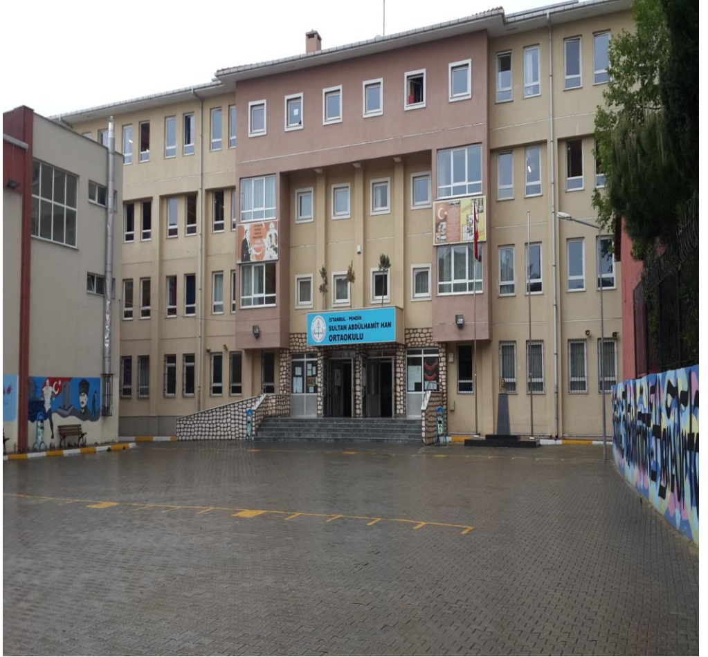
SULTAN ABDÜLHAMİT HAN ORTAOKULU